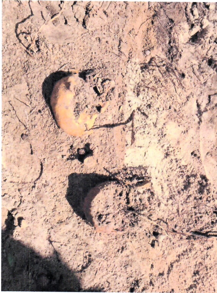
Fotografie z 25 lipca 2024 r. – budowa ciepłociągu (do protokołu)