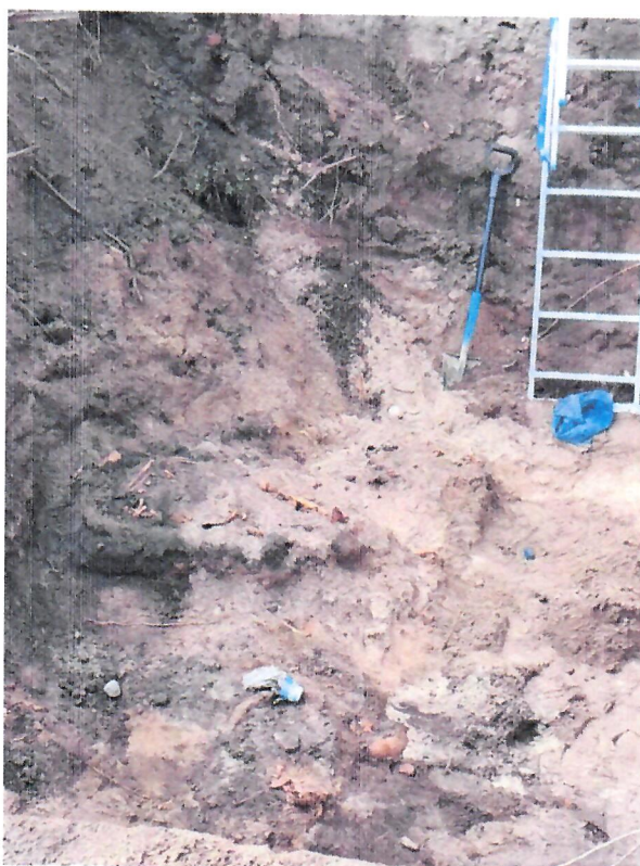
Fotografie z 25 lipca 2024 r. – budowa ciepłociągu (do protokołu)