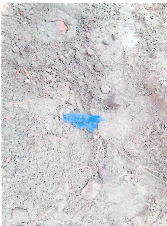
Fotografie z 25 lipca 2024 r. – budowa ciepłociągu (do protokołu)