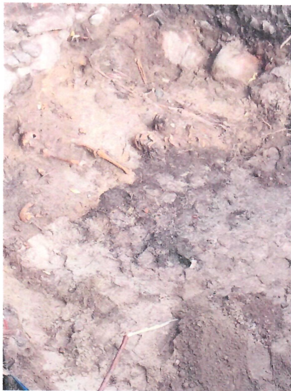
Fotografie z 25 lipca 2024 r. – budowa ciepłociągu (do protokołu)