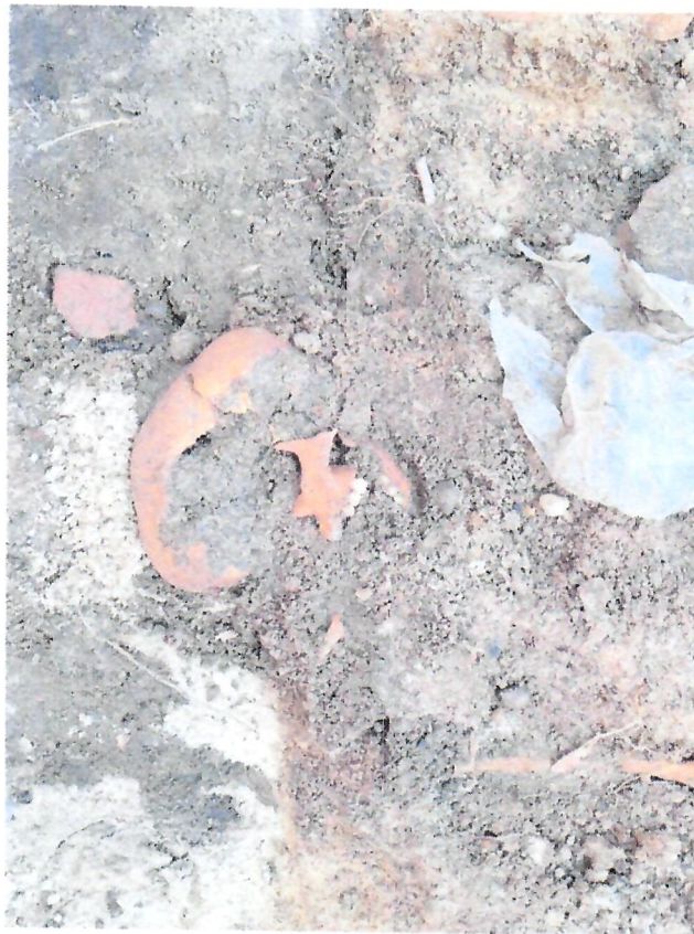
Fotografie z 25 lipca 2024 r. – budowa ciepłociągu (do protokołu)