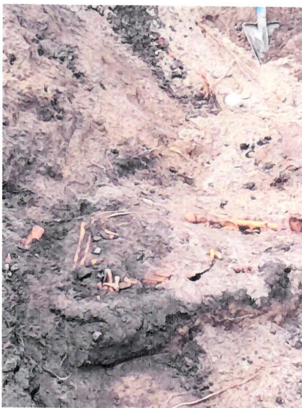
Fotografie z 25 lipca 2024 r. – budowa ciepłociągu (do protokołu)