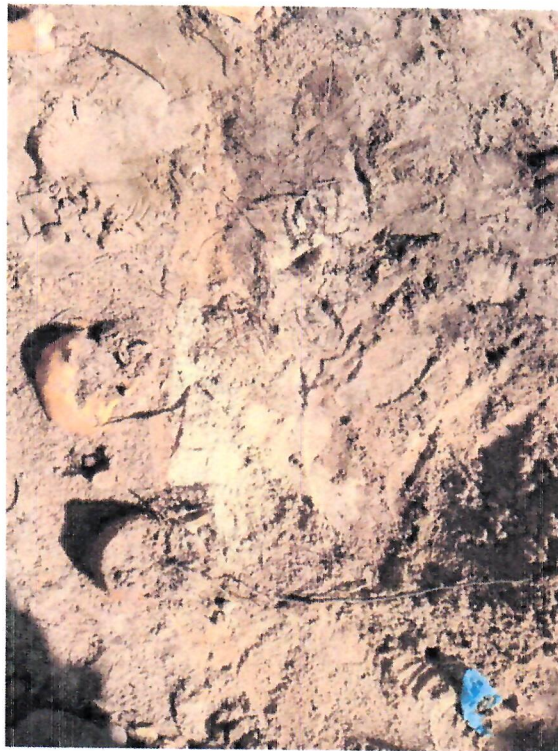
Fotografie z 25 lipca 2024 r. – budowa ciepłociągu (do protokołu)