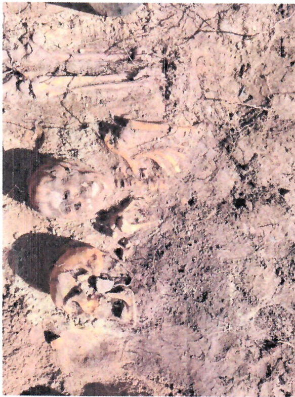
Fotografie z 25 lipca 2024 r. – budowa ciepłociągu (do protokołu)