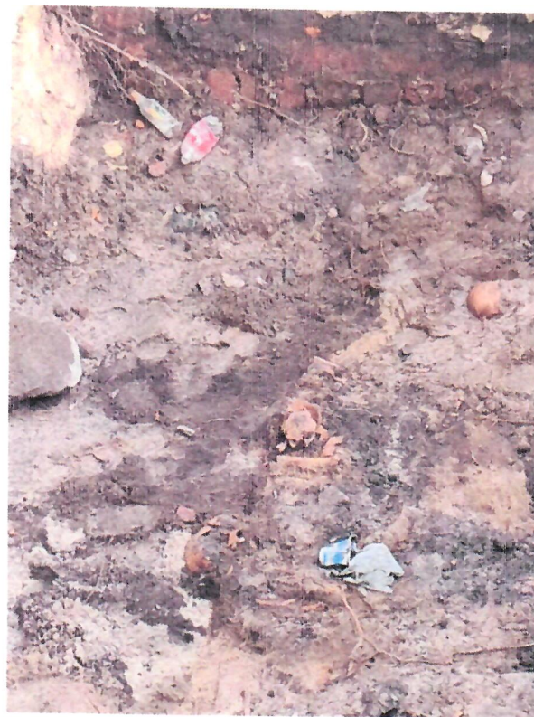
Fotografie z 25 lipca 2024 r. – budowa ciepłociągu (do protokołu)